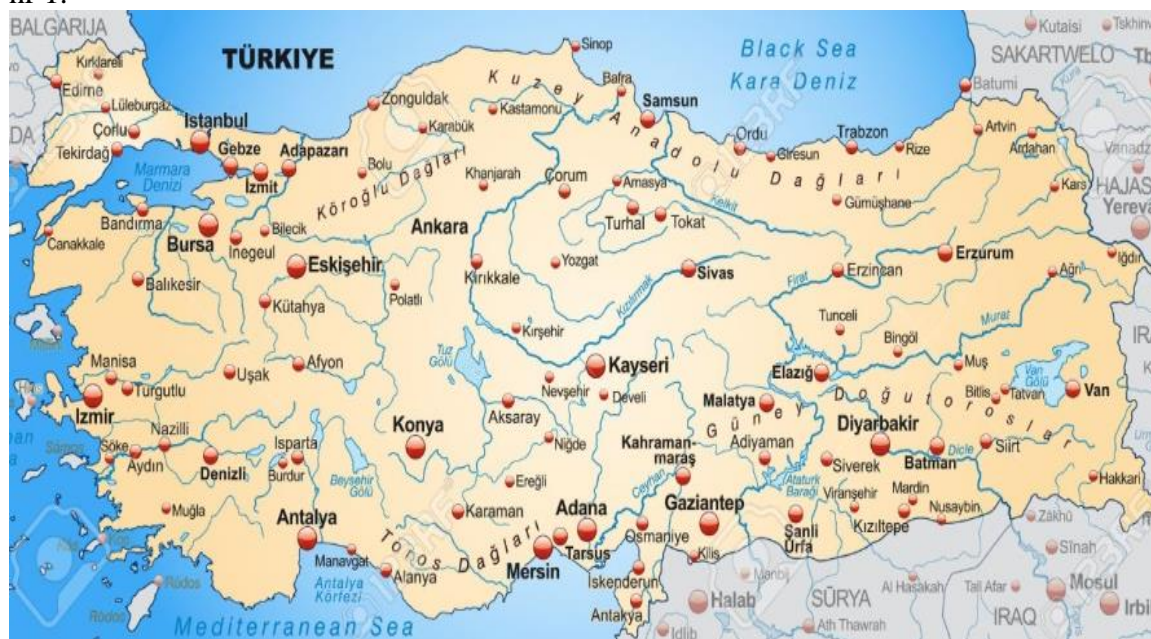
Rys. 1. Strategiczne położenie Turcji uwzględniając sąsiedztwa.

Egejskim i Morzem Marmara, a od południa Morzem Śródziemnym, co obrazuje rysunek nr 1.