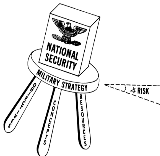
Rys. 4. Wpływ zagrożenia na nieodpowiednie zbalansowanie czynników bezpieczeństwa

Model przedstawiony na rysunku nr 3 opisuje koncepcję opartą na równoważących się wzajemnie nogach złożonych z obiektów, koncepcji strategicznych oraz zasobów. W sytuacji, gdy któryś z filarów bezpieczeństwa narodowego nie jest spełniony może dojść do zagrożenia bezpieczeństwa państwa.