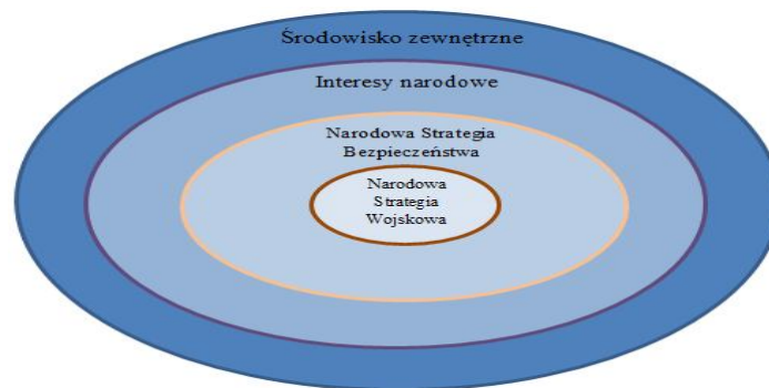
Rys. 2. Wszechobecność strategii

A. F. Lykke podkreśla rozróżnienie pomiędzy wytworem, jakim jest Narodowa Strategia Bezpieczeństwa a Narodową Strategią Wojskową, zaznaczając, iż jest ona elementem wszechobecnej strategii krajowej.