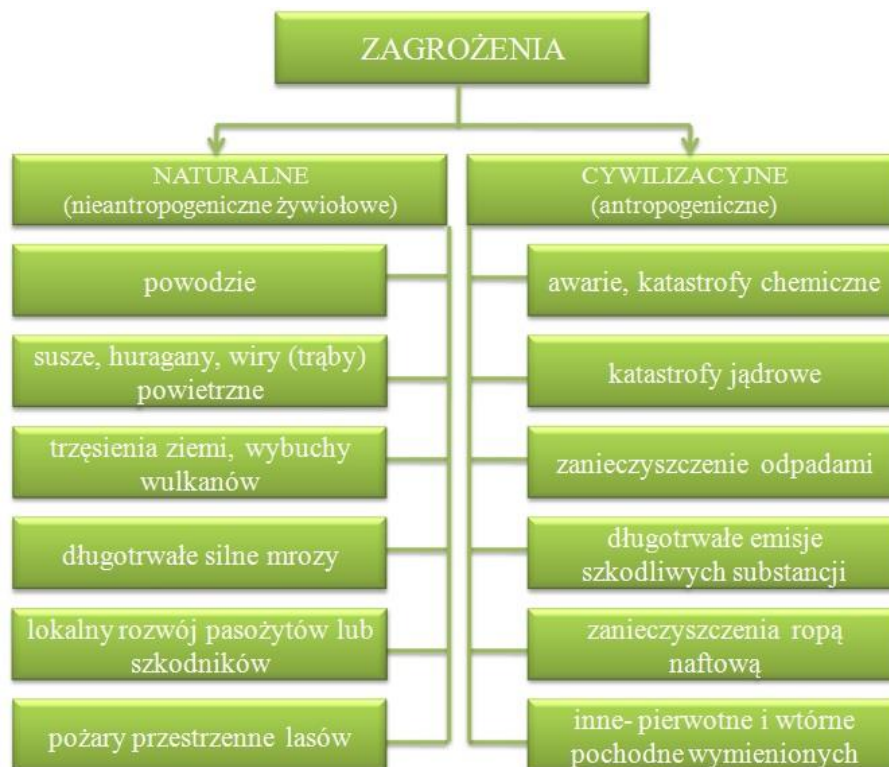
Rys. 2. Zagrożenia bezpieczeństwa ekologicznego

Jak już wcześniej zostało zaznaczone, bezpieczeństwo ma ścisły związek z zagrożeniem. Warto się zastanowić nad zagrożeniami bezpieczeństwa ekologicznego (rys. 2).