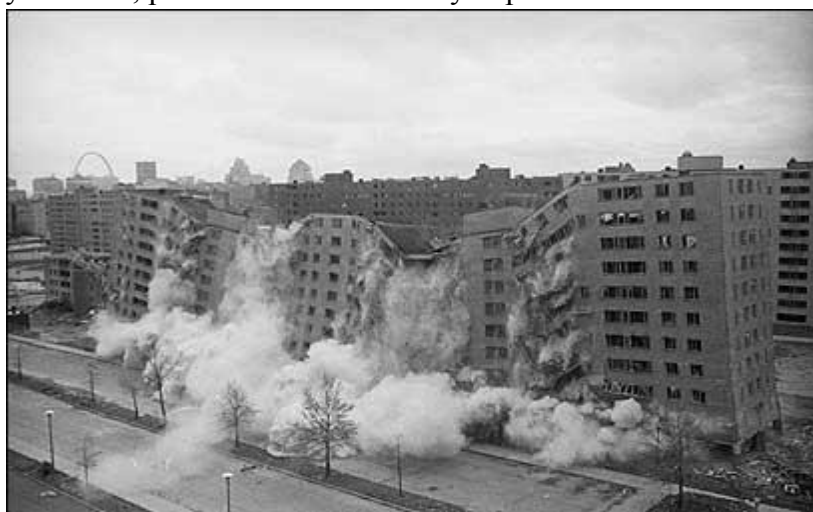
Zdjęcie 3 Wyburzenie Pruitt-Igoe

Pomimo podejmowanych prób naprawczych takiego stanu rzeczy, na początku lat 70. XX w. zdecydowano, iż wszelkie plany naprawcze są nieskuteczne i bezcelowe zarówno z ekonomicznego punktu widzenia, jak i społecznego. W związku z tym podjęto decyzję o jego wyburzeniu, pierwsze ładunki zostały odpalone w 1972 r.