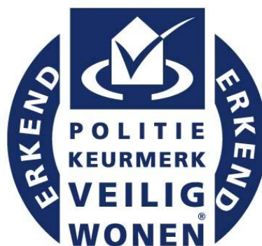
Rys. 4. Logo Policyjnego znaku jakości „Bezpieczne mieszkanie”