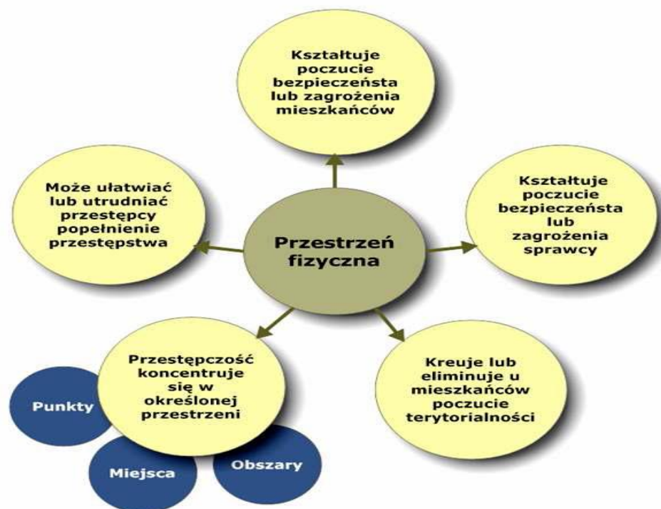
Rys. 1. Wpływ przestrzeni fizycznej na bezpieczeństwo