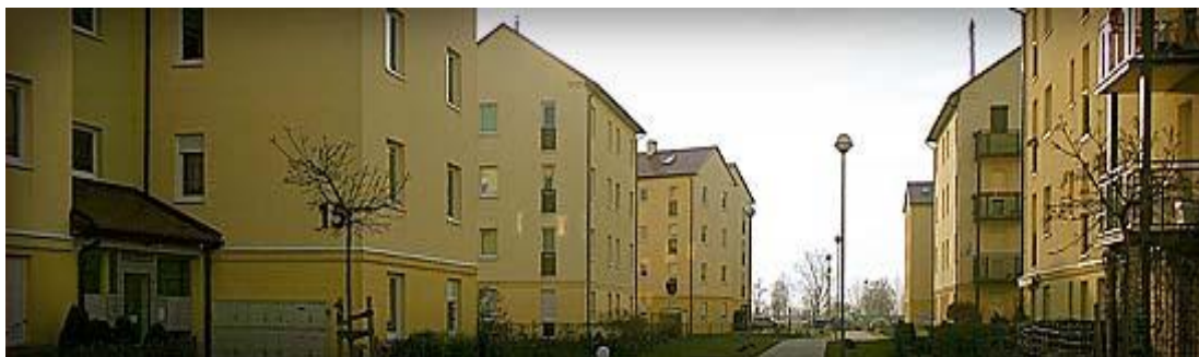
Zdjęcie 4. Osiedle w Siechnicach

Ruch kołowy został wyłączony na osiedlu, a parkingi usytuowano na zewnętrznej strefie, umożliwiając właścicielom obserwację samochodu. Zabudowa jest prosta, nie posiada żadnych załamania uniemożliwiających obserwację, lub ułatwiających ukrycie się potencjalnego przestępcy 28 .