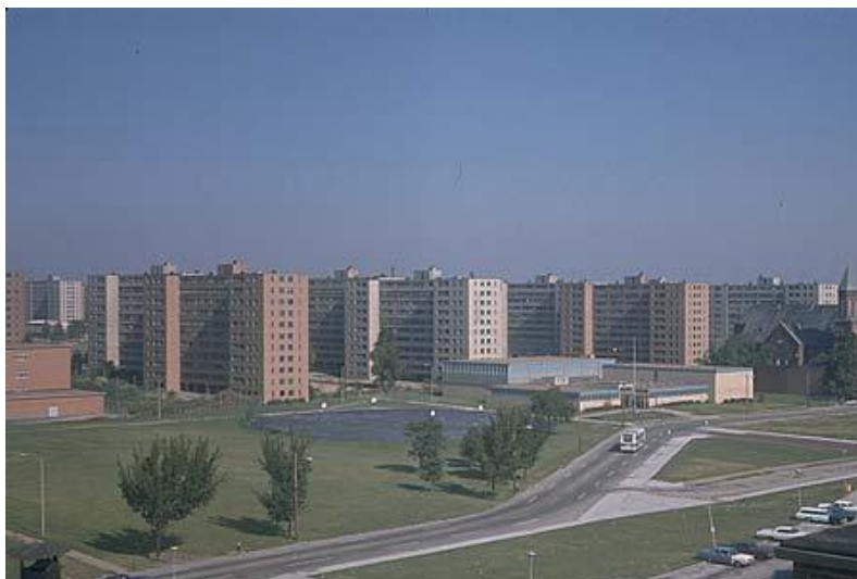
Zdjęcie 1. Osiedle Pruitt-Igoe.