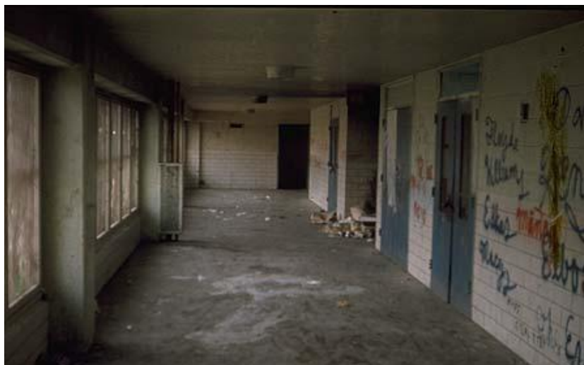
Zdjęcie 2. Dewastacja osiedla Prut-Igoe.

Lata 60. nie przyniosły oszołamiającego sukcesu projektu, gdyż jego zasiedlenie nie przekroczyło 90%, a po decyzji o podniesieniu czynszu dla mieszkańców przez lokalnych zarządców w 1967, dramatycznie spadło do przedziału 20-30%. W wyniku tego lawinowe wyprowadzki doprowadziły do dewastacji i całkowitego wyłączenia z użytkowania aż 17 z 20 bloków mieszkalnych.